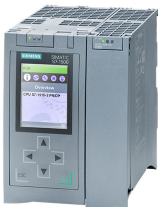
SIMATIC S7-1500 вместе с CP 1545-1

Устройство CP 1545-1 представляет собой шлюз данных для Интернета Вещей в виде коммуникационного модуля для работы в составе ПЛК S7-1500. Если вы планируете строить или эксплуатируете новый объект, то это самый подходящий случай для создания подключенного к сети завода, так как у вас есть отличная возможность реализовать передовые концепции цифровизации. Планирование и инженерно-конструкторские работы выполняются целиком через TIA Portal. Что это значит с точки зрения облачного подключения? То, что поддерживающая его инфраструктура будет невероятно простой и компактной. Больше не нужно подключать к облаку каждый датчик — продукт SIMATIC S7-1500 идеально подойдет для объединения данных с объектов и их привязки (по возможности) к дополнительным сведениям о процессах. Процессор связи CP 1545-1 «забирает» показатели процессов у ЦП S7-1500 через объединяющую шину и передает их в облако по стандартизированному протоколу MQTT.