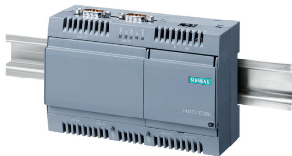
SIMATIC IOT2040 на DIN-рейке